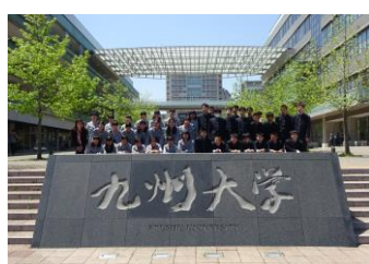
大学訪問（九州大学）