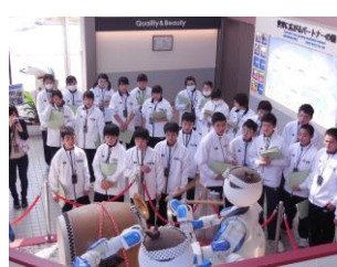
企業訪問（安川電機）